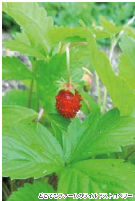
どこでもファームのワイルドストロベリー

おおさかなんこう 大阪南港 ATC おおさか ATC グリーンエコプラザ セミナールーム集合