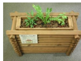
『どこでもプランター』 空気まで美しくします 山を守る間伐材使用

農商工連携による 吉野町の地域活性化事業に取り組み、 吉野町功労賞を受賞しました。